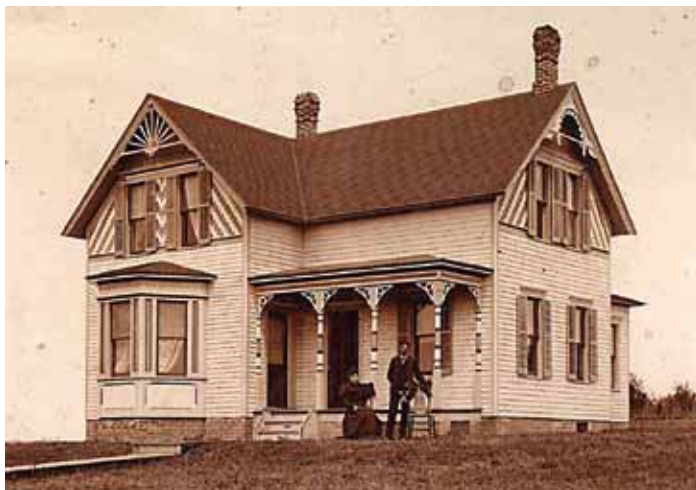
Obr. 13 Dům českého krajana v Colfax, Ohio. 70. léta 19.století

Zcela zvláštní kategorii tvoří fotografie budov – soukromých obydlí, škol, spolkových budov, kostelů, farem, obchodů, hostinců a výrobních podniků. Zachycují obrovskou typovou pestrost, např. v bydlení od polozemnic přes sruby, dřevěné domky, cihlové vilky až po honosné domy. Podobně pohledy na nově založená městečka dokumentují historii, která se již dávno ztratila.