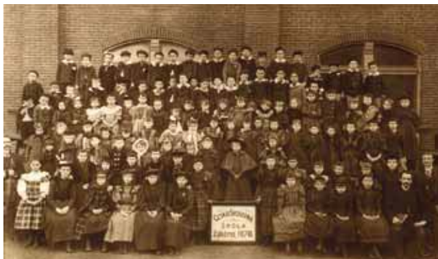
Obr. 14 Žáci České svobodné školy v St. Louis, Missouri. Foto 90. léta 19. století