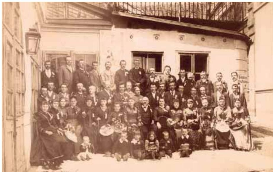
Obr. 9 Češi z Ameriky na dvoře domu U Halánků při příležitosti návštěvy na Zemské jubilejní výstavě v Praze v r. 1891