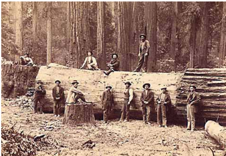
Obr. 11 Dřevorubci sekvoji v lesích bratří Korbelů v Kalifornii. Foto 80. léta 19. století