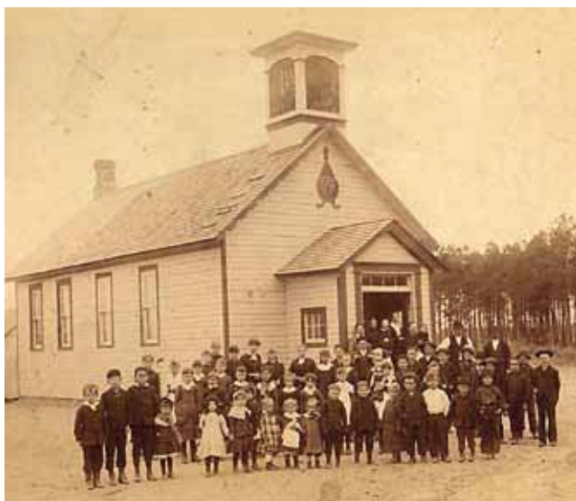
Obr. 15 Žáci se svými učitelkami před budovou české školy v Bohemii. New York. Foto 70. léta 19. století