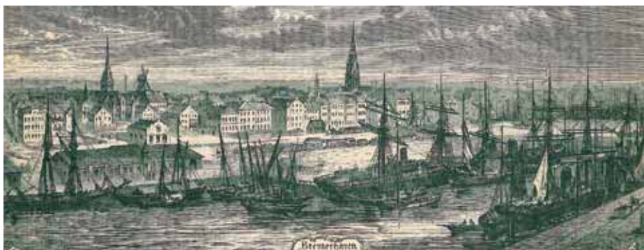
Obr. 1 Brémy v roce 1868. Odtud přepravovala české vystěhovalce firma Kareš a Stocký

Dokumentace vystěhovalectví a krajanství asi nejvíce propojuje knihovni a archivní fond Náprstkovy muzea. 20 Je velmi úzce svázána s osobou jeho zakladatele Vojty Náprstka, který musel po revoluci 1848 emigrovat a následující desetiletí prožil v Americe. Poznal život českých vystěhovalců, snažil se jim všemožně pomáhat a organizoval krajanový život. O problematiku vystěhovalectví či krajanství se intenzivně zajímal i po svém návratu do Čech. Udržoval kontakty s českými krajany, zprostředkovával je zájemcům o vystěhování, poskytoval finanční podporu apod. Především se ale stal významným dokumentátorem krajanového života. Jeho američtí přátelé mu posílali nejrůznější krajanové tisky a periodika, on posílal nazpět českou literaturu, kterou vybavoval české školy, krajanové knihovny apod. V této činnosti s ním spolupracovala také jeho žena Josefa, která se snažila i po jeho smrti v započatém díle pokračovat a až do roku 1903 důsledně shromažďovala nejrůznější dokumentační materiál. 21 Tyto snahy byly více či méně respektovány i později a odrážely se v akviziční činnosti Knihovny Náprstkovy muzea i archivu, který byl její nedílnou součástí. Tento archiv vznikl víceméně spontánně, jeho základem se stala Náprstkovy pozůstalost a získá-