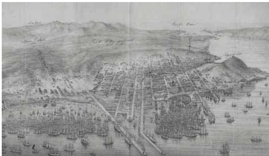
Obr. 2 San Francisco v roce 1852

váním dalších archivních fondů a sbírek se rozrostl do dnešní podoby. Od roku 2012 je zařazen do sbírkového oddělení Náprstkova muzea. Je v něm uloženo přes sto archivních fondů a sbírek a celkem představuje téměř 1000 běžných metrů archiválií převážně z druhé poloviny 19. století.