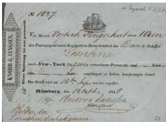
Obr. 3 Lodní lístek V. Náprstka k cestě do Ameriky, 1848

Specifickou část pozůstalosti představuje soubor dokumentů vztahující se k Náprstkově čítárně a obchodu. Jedná se o tzv. „Vydání pro čítárnu – Lesehalle Ausgaben“ 26 , kopiář knižních objednávek a korespondence knihkupectví v Milwaukee 27 a sešit „Record“ s koncepty dopisů z obchodní činnosti Vojty Náprstka v Milwaukee. 28 Dochovaly se rovněž tři Náprstkovy účetní knihy z let 1850–1853 a další drobnosti, např. účty, seznamy zboží apod. 29 Naprosto unikátní je ovšem Náprstkova obchodní korespondence, která čítá přibližně 1700 dopisů z období 1849–1858 30 , nebo korespondence, ale i další doklady týkající se obchodu a vydávání časopisu Flug-Blätter. 31 Bez zajímavosti nejsou ani archiválie dokumentující Náprstkovu veřejnou činnost, např. text jeho přednášky v St. Paul z r. 1856. 32