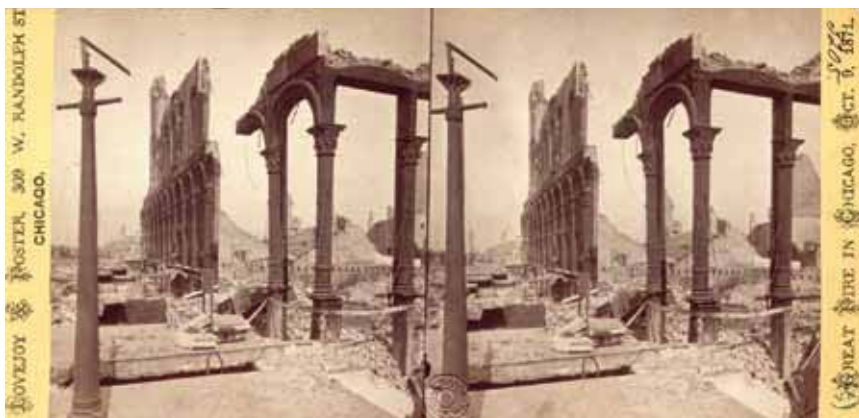
Obr. 10 Chicago po velkém požáru r. 1871. Stereoskopický snímek