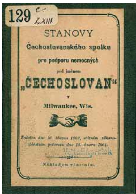
Obr. 7 Stanovy spolku Českoslovan v Milwaukee, 1864

Stejně jako v „Krajanství 1“ je také zde uloženo velké množství spolkové dokumentace či zpracování historie jednotlivých spolků. Jedná se např. o Dějiny besedního Sboru „Kollar“ v Milwaukee z r. 1895 69 nebo další pojednání o Českoamerických střelcích Svornost, zmíněné již v „Krajanství 1“. 70