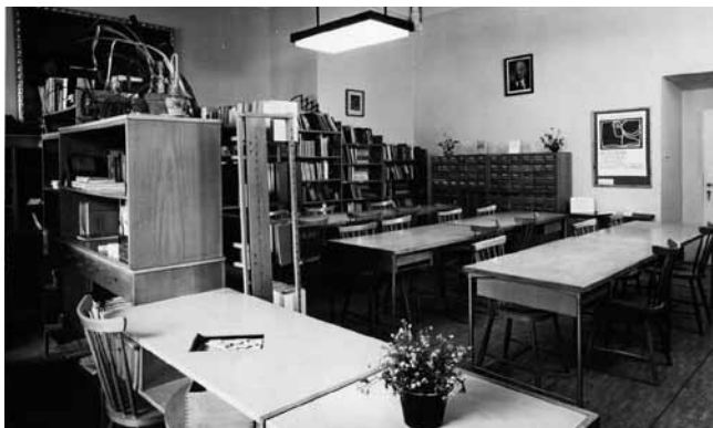
Obr. 2 Studovna s novým vývojeým nábytkem v 70. letech

Zaměření prvních roků činnosti studovny knihovnické literatury pracovat jako odborná příruční knihovna metodického a vědecko-výzkumného pracoviště Národní knihovny se postupně v důsledku měnících se společenských a informačních potřeb přiměřeně rozšířilo, zejména vlivem informačních požadavků studentů a pedagogů Filozofické fakulty Univerzity Karlovy.