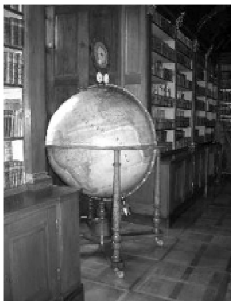
Obr. č. 3a a 3b Glóbus a hodiny V. Slouka

Vojtěch Slouk – v letech 1860–1876 sestavil velký glóbus a hodiny ukazující čas na různých místech zeměkoule. Obě památky lze vidět v sále knihovny.