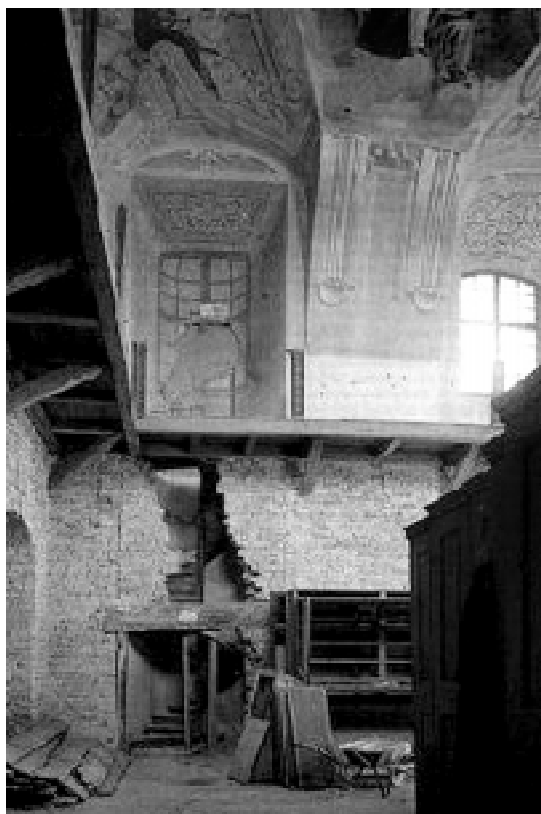
Obr. č. 4a Stav části klášterní knihovny v roce 1990

i dalších stavebních prací. Jejím přičiněním bylo opraveno přizemí jižního, severního a částečně východního křídla. To umožnilo pohodlný přístup k prostorám knihovny. O postupu prací informuje nadace na svých webových stránkách (viz http://www.rajhrad.cz/oraetlabora/ ). Průběžně je také zveřejňována fotodokumentace rekonstrukčních prací.