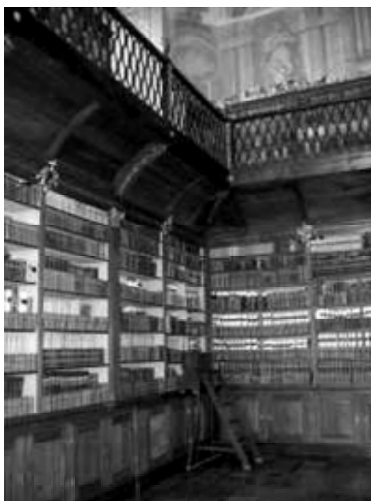
Obr. č. 4d Knihovní sál (stav v roce 2004)