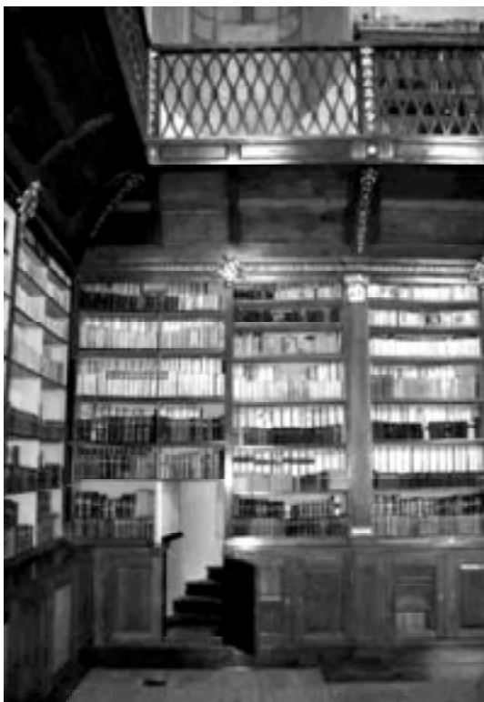
Obr. č. 4b Stav téže části v roce 2004