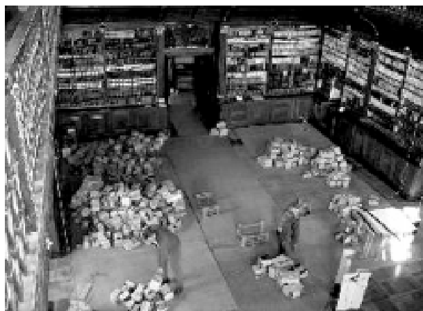
Obr. č. 5a Ukládání knih do regálů (2004)

Současně s opravou hlavního sálu a předsálí klášterní knihovny probíhaly opravy sousedících místností v jižním klášterním křídle, které sloužily jako sklady dalšího knihovního fondu. S financováním oprav těchto prostor významně pomohla právě nadace Ora et Labora. Místnosti byly stavebně upraveny na sklady a pracovny. V pracovnách bylo zprovozněno plynové topení. Po dokončení těchto prací byly ve skladové části sestaveny regály a tak se mohly první knihovní fondy vracet na původní místo. K tomu došlo v roce 2002. V roce 2004 po dokončení restaurátorských prací v sále začala druhá etapa rekonstrukce knihovny – nastěhování knihovního fondu do historického sálu a předsálí.