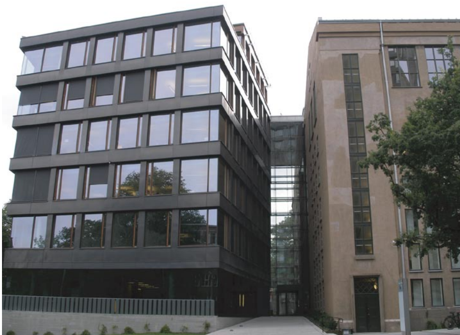
Přístavby za historickou budovou NK Norska

Velikost historické budovy z roku 1913 odpovídala požadavkům doby jejího vzniku. Budova má však za sebou dostatečně velké pozemky umožňující její růst směrem dozadu. Nové přístavby vypovídají svým charakterem o době vzniku.