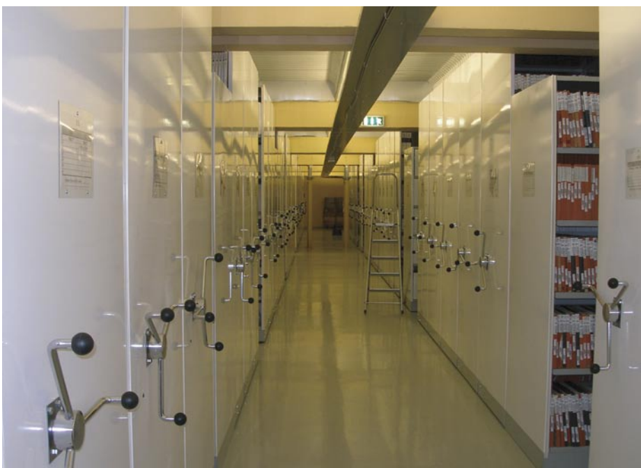
Sklady analogových dokumentů

V ideálních podmínkách je zde uloženo norské národní kulturní dědictví v analogové podobě. Nejedná se jen o u nás běžné knihy, periodika a některé speciální dokumenty, ale i rozhlasový, televizní a filmový archiv.