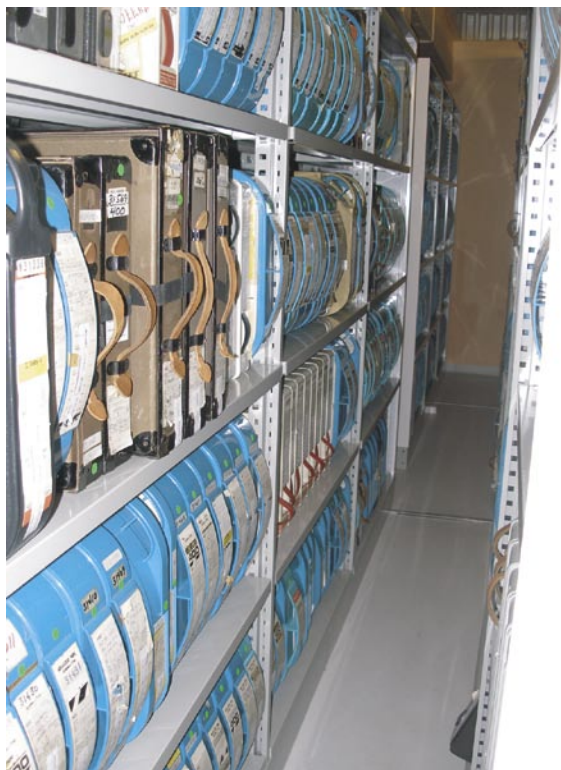
Sklady analogových dokumentů

Všechny fondy Národní knihovny Norska jsou postupně digitalizovány a i centrální digitální repozitář pro národní kulturní dědictví v digitální podobě je uložen ve skále s tím, že existuje ještě jedna kopie v jiné lokalitě.