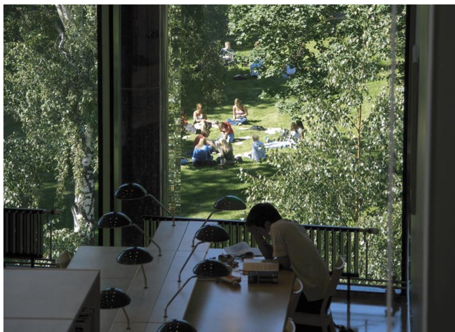
Interiér knihovny Univerzity v Oslo + propojení s parkem