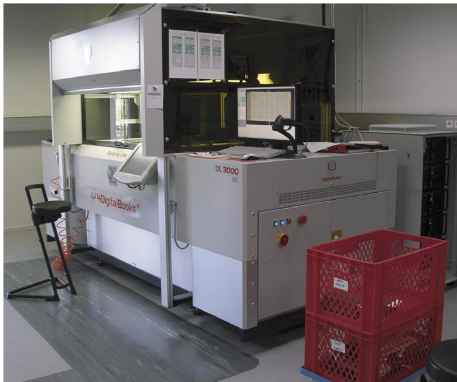
Robotický skener DL 3000

Jak již bylo řečeno, Národní knihovna Norska hodlá postupně digitalizovat všechny své fondy – čili nejen své národní kulturní dědictví. Již dnes je vybavena kvalitními přístroji pro digitalizaci nejen „klasických“ knihovnických dokumentů, ale i filmů, rozhlasové a televizního vysílání a dalších dokumentů. Vlastní mj. i nákladné robotické skenery s automatickým obracením stránek, včetně skeneru DL 3000, který plánují zakoupit NK ČR a MZK.