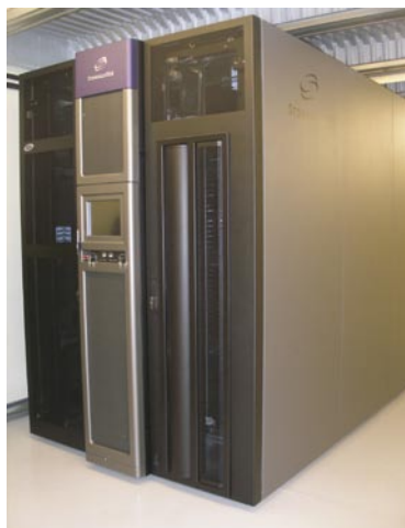
Uložení digitálních dokumentů

Při procházení obrovských, účelově a optimálně vybudovaných a vybavených a dokonale čistých skladovacích prostor se mi neodbytně vybavovaly vzpomínky na přeplněná, prашná a v létě beznadějně rozpálená skladiště v Klementinu a plnicí se Hostivař. S hořkostí jsem si uvědomila, že neknižovní část českého národního kulturního dědictví je nepochybně uložena v podstatně horších podmínkách bez řádné evidence a v mnoha oblastech není ani jednoznačně stanovena gesce za dlouhodobou ochranu příslušných dokumentů.