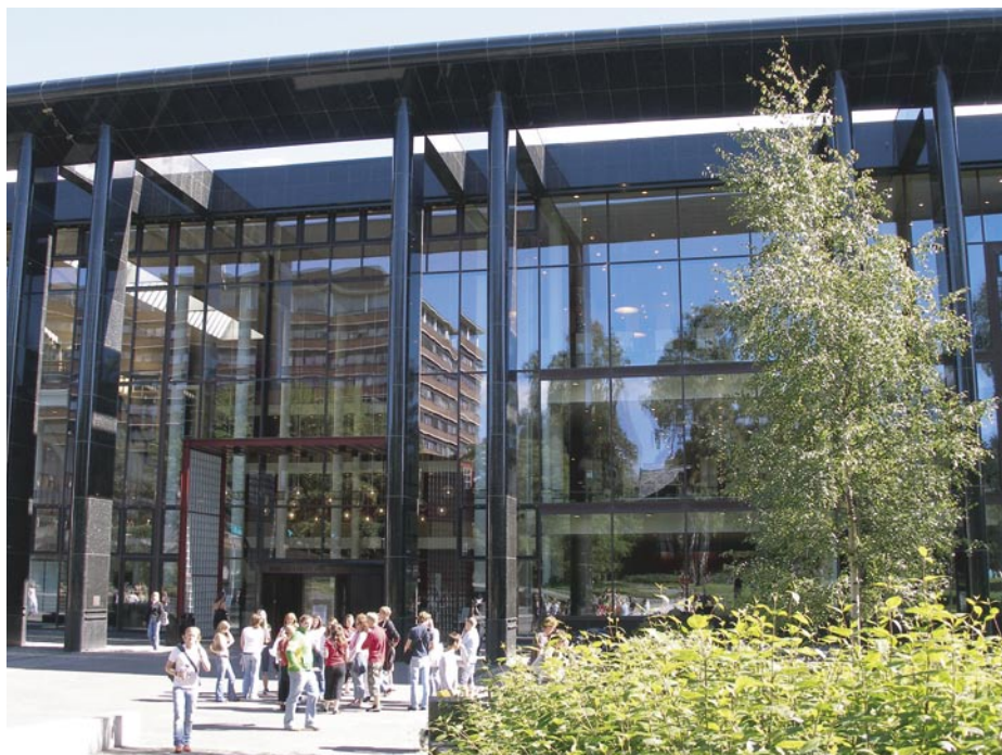
Exteriér knihovny Univerzity v Oslo