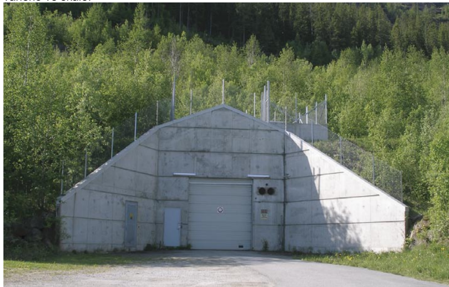
Vchod do skalního masivu

Vcelku nenápadné dveře ukrývají vchod do rozsáhlého a impozantního areálu vybudovaného ve skále.