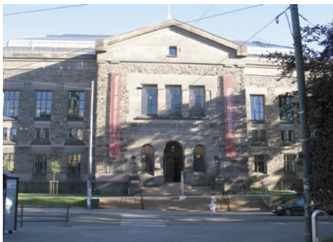
Historická budova NK Norska v Oslo

Budova byla postavena v roce 1913 a původně patřila Univerzitě v Oslo – do roku 1999 byly v Norsku funkce univerzitní a národní knihovny spojeny. S ohledem na silný akcent na ochranu, zpřístupnění a propagaci národního kulturního dědictví v národním i mezinárodním kontextu byly funkce s ním svázané odděleny na podkladě rozhodnutí norského parlamentu. Národní knihovna si (kromě pobočky v Mo I Raně z roku 1989) ponechala historickou budovu původně univerzitní + národní knihovny, pro univerzitu byla postavena nová budova přímo v univerzitním kampusu. Budova univerzitní knihovny je ideálně propojena s okolním parkem.