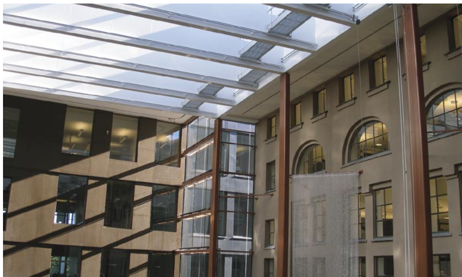
Interiér rekonstruované historické budovy NK Norska

Přestřešením a propojením původně venkovních prostor vznikla rozlehlá atria a prostory pro stravování, shromažďování a odpočinek.