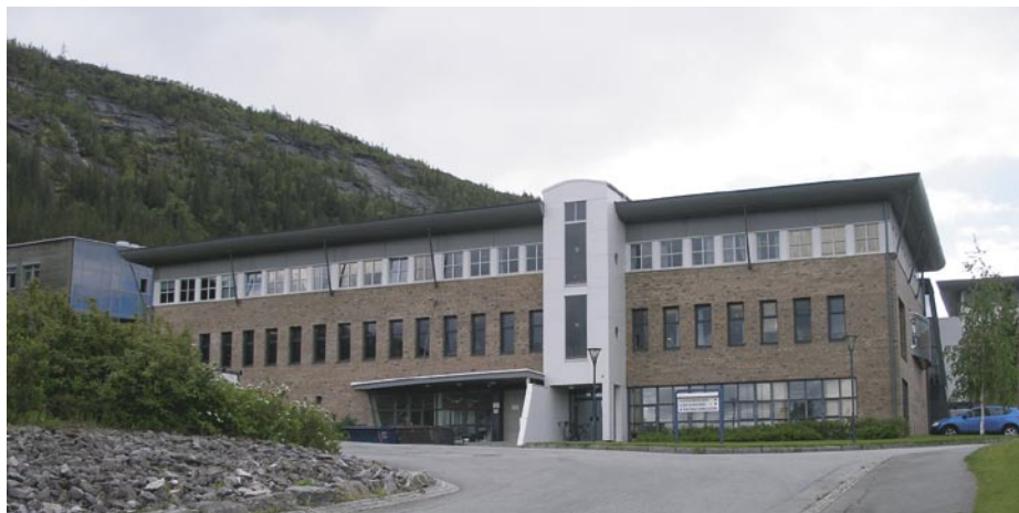
Pobočka Národní knihovny Norska v Mo I Raně

regionů, kde došlo k útlumu těžkého průmyslu. Instituce, které nabídly nové pracovní příležitosti vázané na programy spojené s realizací strategických priorit státu, obdržely na realizaci i dlouhodobou udržitelnost svých záměrů významné státní dotace. Ne náhodou je pobočka Norské národní knihovny v Mo I Raně, která pečuje o povinné výtisky a další dokumenty, umístěna v těsném sousedství mohutného skalního masivu.