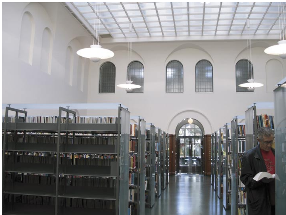
Interiér rekonstruované historické budovy NK Norska

Největší modernizace související s „prošpikováním“ budovy moderními technologiemi není na první pohled vidět.