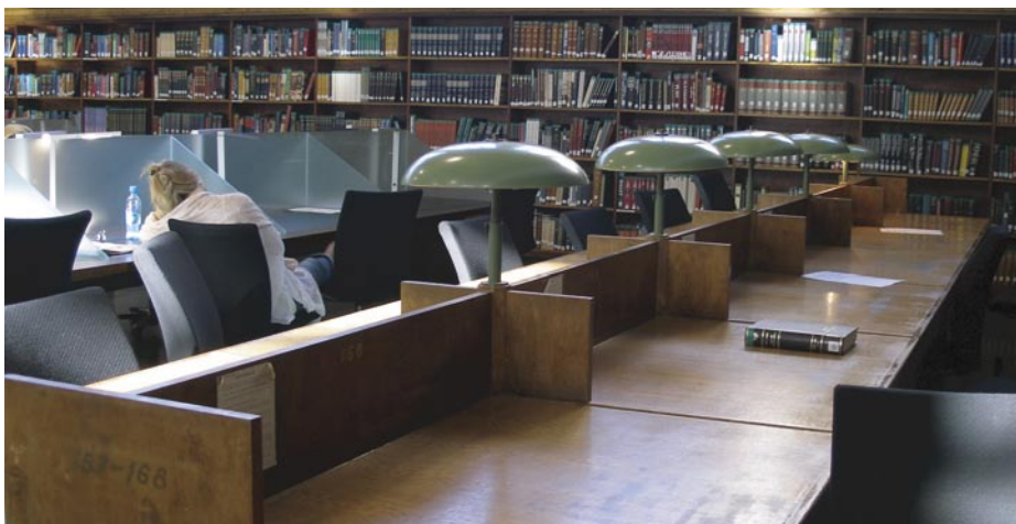
Interiér rekonstruované historické budovy NK Norska

Rekonstruovaná budova byla slavnostně nově otevřena u příležitosti mezinárodního kongresu IFLA v roce 2005. Historická budova je památkově chráněna, proto rekonstrukce musela respektovat historický charakter budovy. Přesto jsou zde citlivě uplatněny viditelné moderní prvky.